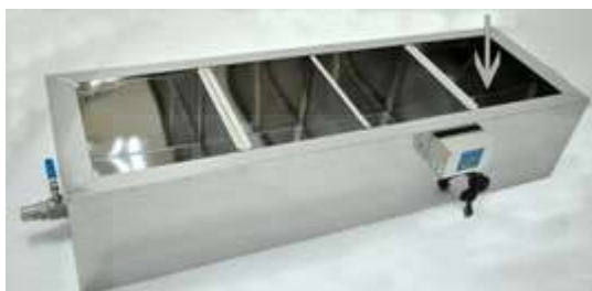
A szűrő maximális megtölhető szintje