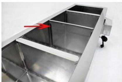
Maximálna výška naplnenia cedníka